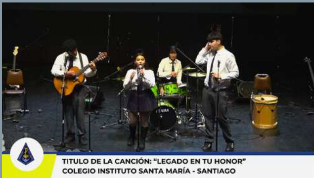
TITULO DE LA CANCIÓN: "LEGADO EN TU HONOR" COLEGIO INSTITUTO SANTA MARÍA - SANTIAGO