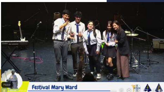
Festival Mary Ward