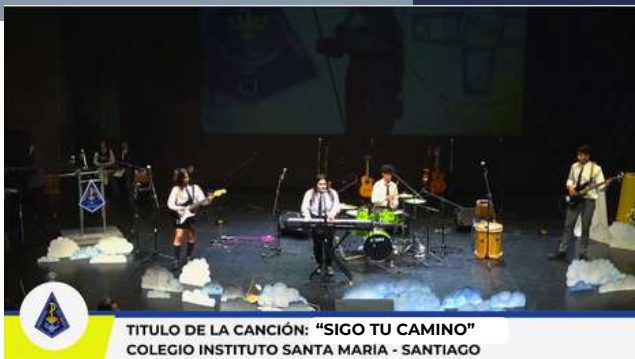
TITULO DE LA CANCIÓN: "SIGO TU CAMINO" COLEGIO INSTITUTO SANTA MARÍA - SANTIAGO